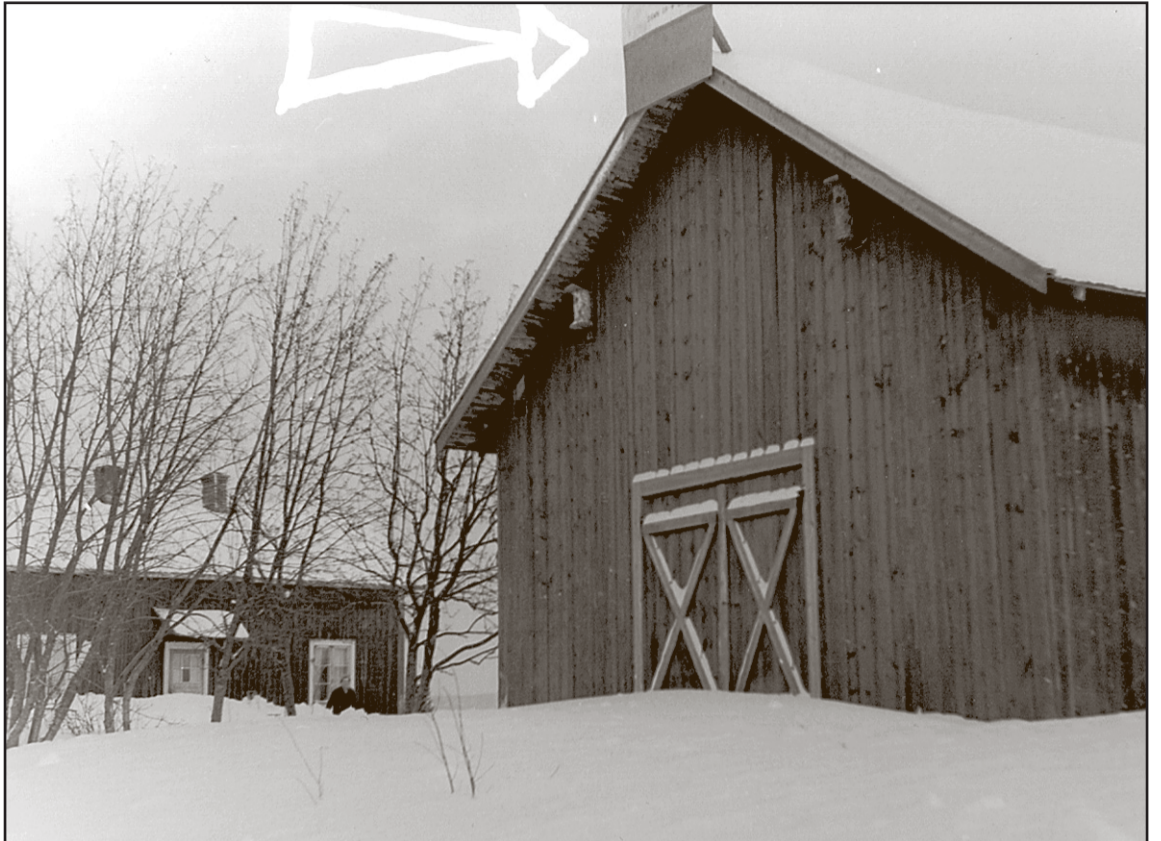
Vattnet som översvämde Hällby skulle gå över taknocken på den här uthusbyggnaden.